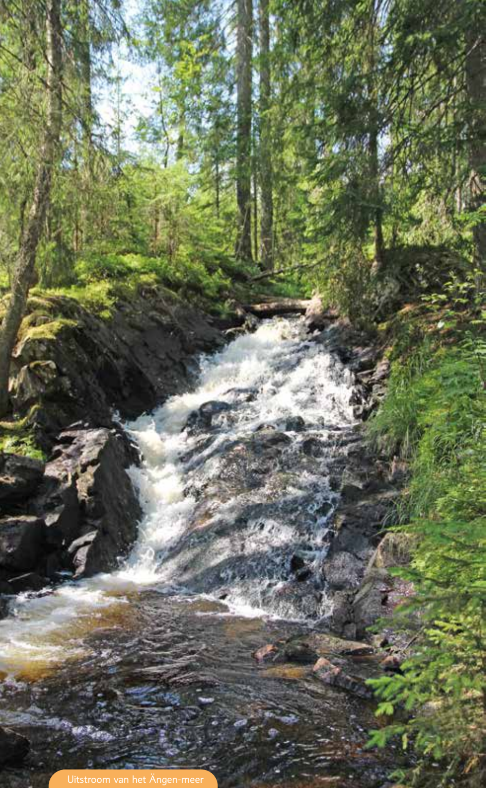
Uitstroom van het Ängen-meer