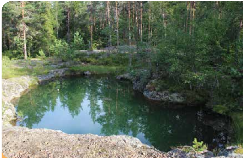
Norra Ängens Gruva