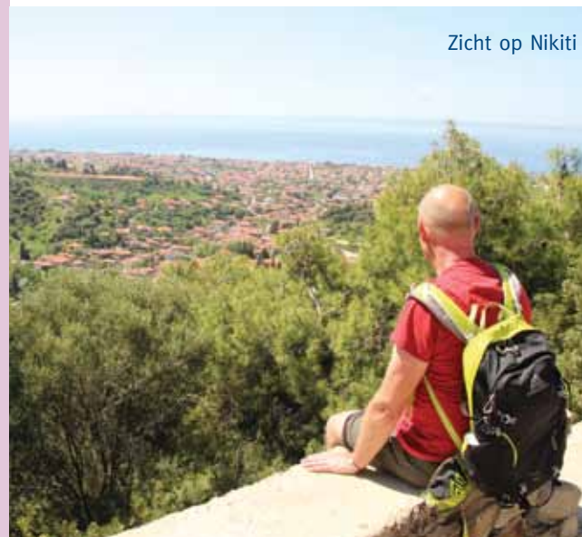
Zicht op Nikiti