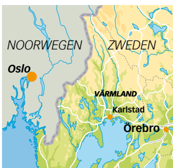
■ PAUL VAN BODENGRAVEN

Värmland, een provincie in midden-Zweden, tegen de Noorse grens, is al eeuwen een gebied van immigranten. Eind 17de eeuw streken hier Finse immigranten neer, die op zoek waren naar nieuwe, onbewoonde gebieden waar ze hun nomadische bestaan in alle rust konden voorzetten. Hun landbouwtechniek, volgens het slash & burn-principe, bestond eruit dat ze stukken bos platbrandden om er het jaar daarna wat gewas op te telen. Was de grond uitgeput, dan moest een nieuw stuk bos er aan geloven.