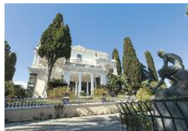
Achilleion, het paleis van keizerin Sissi.

«Dit is mijn asiël, hier trek ik mij terug uit de wereld.» In 1861 bezoekt Elisabeth van Oostenrijk Korfoe voor haar gezondheid. Ver van de strakke hofetiquette en haar ongelukkig huwelijk komt ze tot rust en voelt ze zich vrij. Ze keert terug in 1871, bezoekt meer Griekse bestemmingen en besluit in 1890 tot de bouw van een eigen paleis op Korfoe: Achilleion. Hier wil ze blijven. In 1898 wordt de keizerin in Genève vermoord door een anarchist. Niet lang daarna verkoopt haar dochter Gisela het paleis aan de Duitse keizer Wilhelm II.