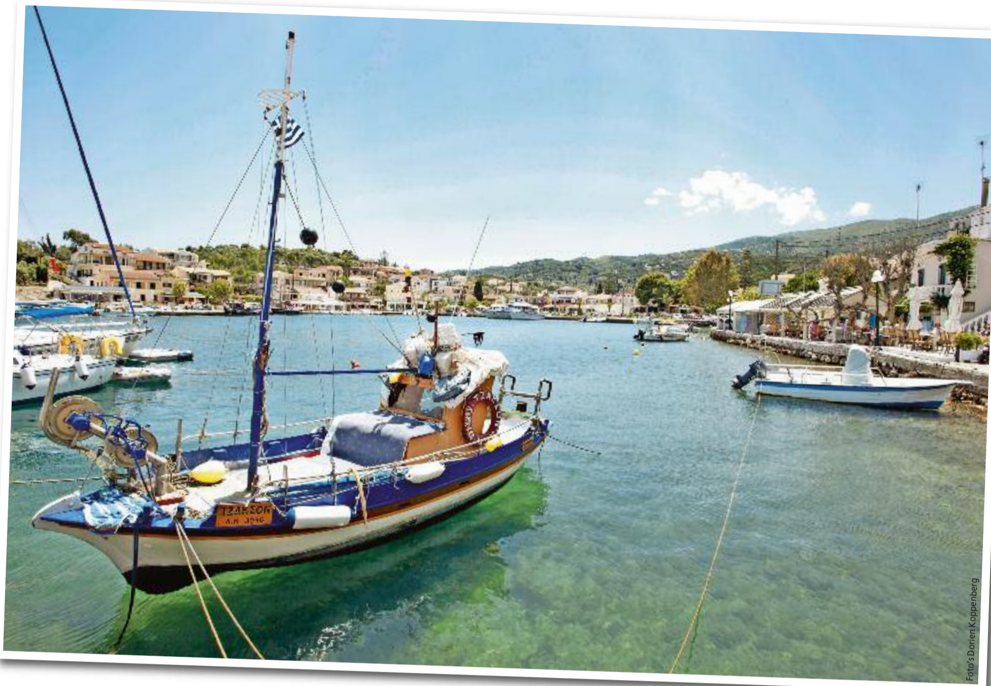
Het idyllische haventje van Kassíopi, perfect om even tot rust te komen.