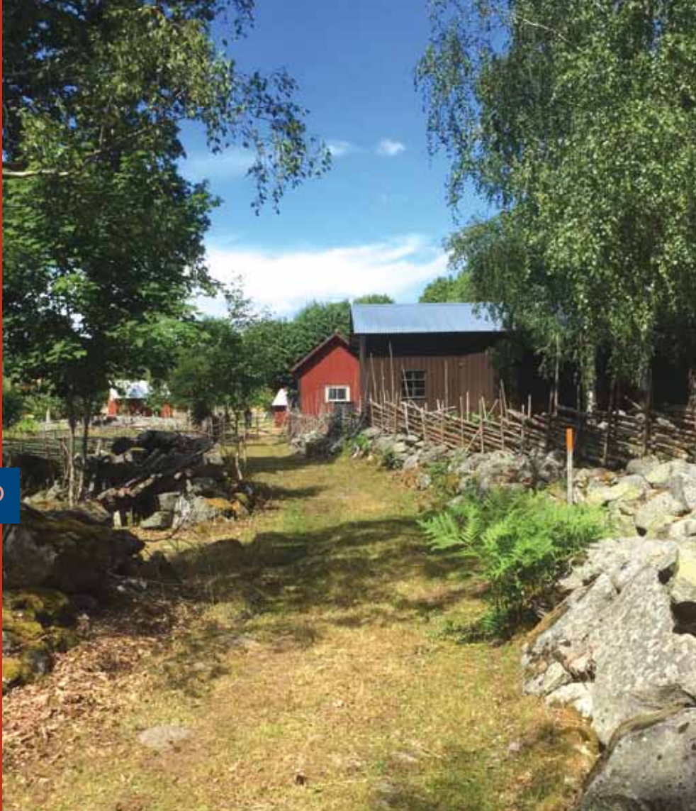
GPS-COÖRDINATEN WANDELING 2 - KRISTDALA - DE BOERENBEDRIJFJES ROND KROKSHULT