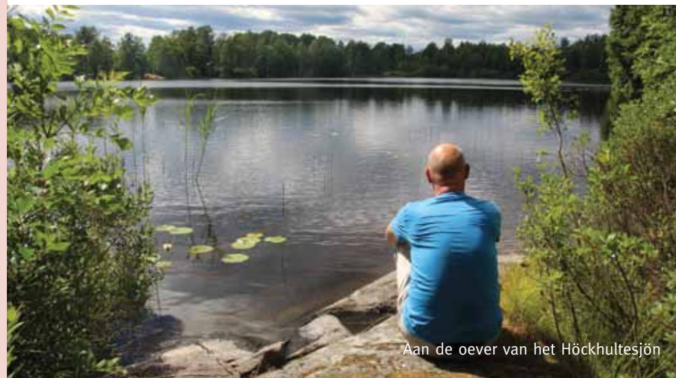
Aan de oever van het Höckhultesjön

Loop voor de hut langs en volg de rode markering door het bos. Na 650 m kom je uit op een steenslagweg. Hier ga je rechtsaf en na 15 m weer linksaf een smal bospad op. Je komt uit op een steenslagweg. Volg die naar rechts tot je uitkomt op een asfaltweg. Ga rechtsaf en volg de weg 1,1 km. Je loopt door het gehuchtje Sund. Dan zie je links een kleine parkeerplaats met een bordje 'Sund'. Volg de weg nog 100 m en ga dan scherp linksaf een steenslagweg (GPS6) op.