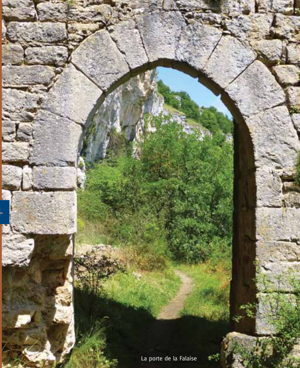
La porte de la Falaise