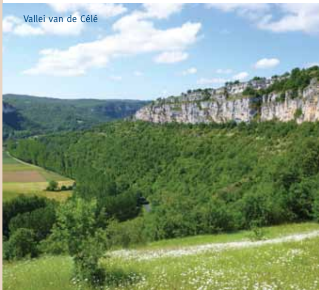
Vallei van de Célé